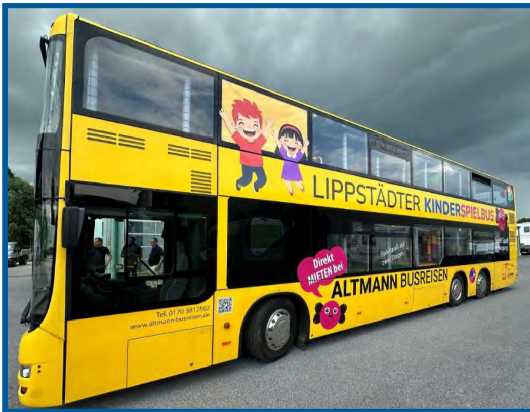
Quietschgelb, ein echter Hingucker: der Lippstädter Kinderspielbus.

Die Idee stammt ursprünglich aus England. Dort gehören Spielbusse bei Familienfesten und Kindergeburtstagen längst dazu. Anstatt die Kinder mit Autos zu einer Attraktion zu bringen, kommt die Attraktion einfach zu ihnen. Die Möglichkeit gibt es jetzt auch in Lippstadt: Für Kindergeburtstage, Schützenfeste und andere Veranstaltungen kann der Spielbus gemietet werden. Beim Altstadtfest können